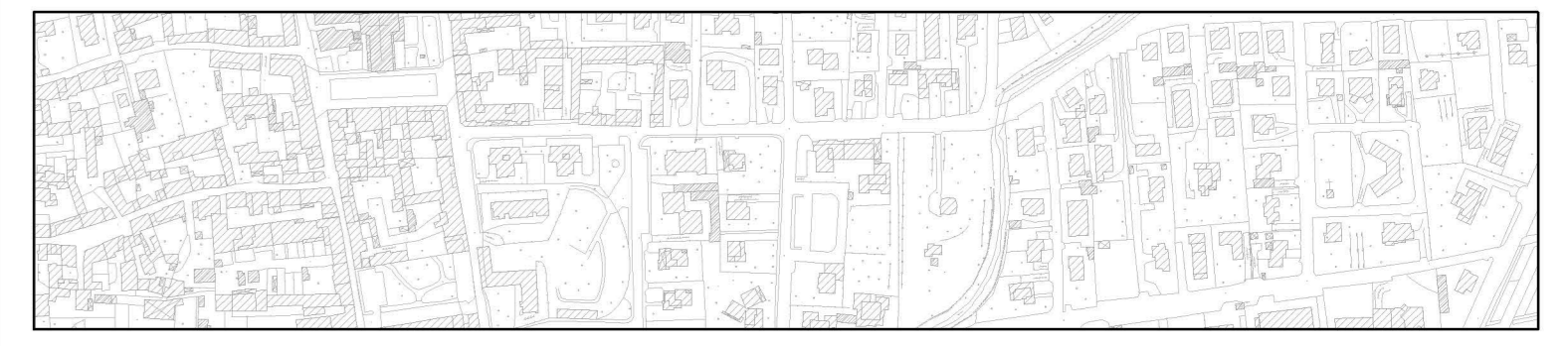
Aerofotogrammetria aggiornata a ottobre 2017