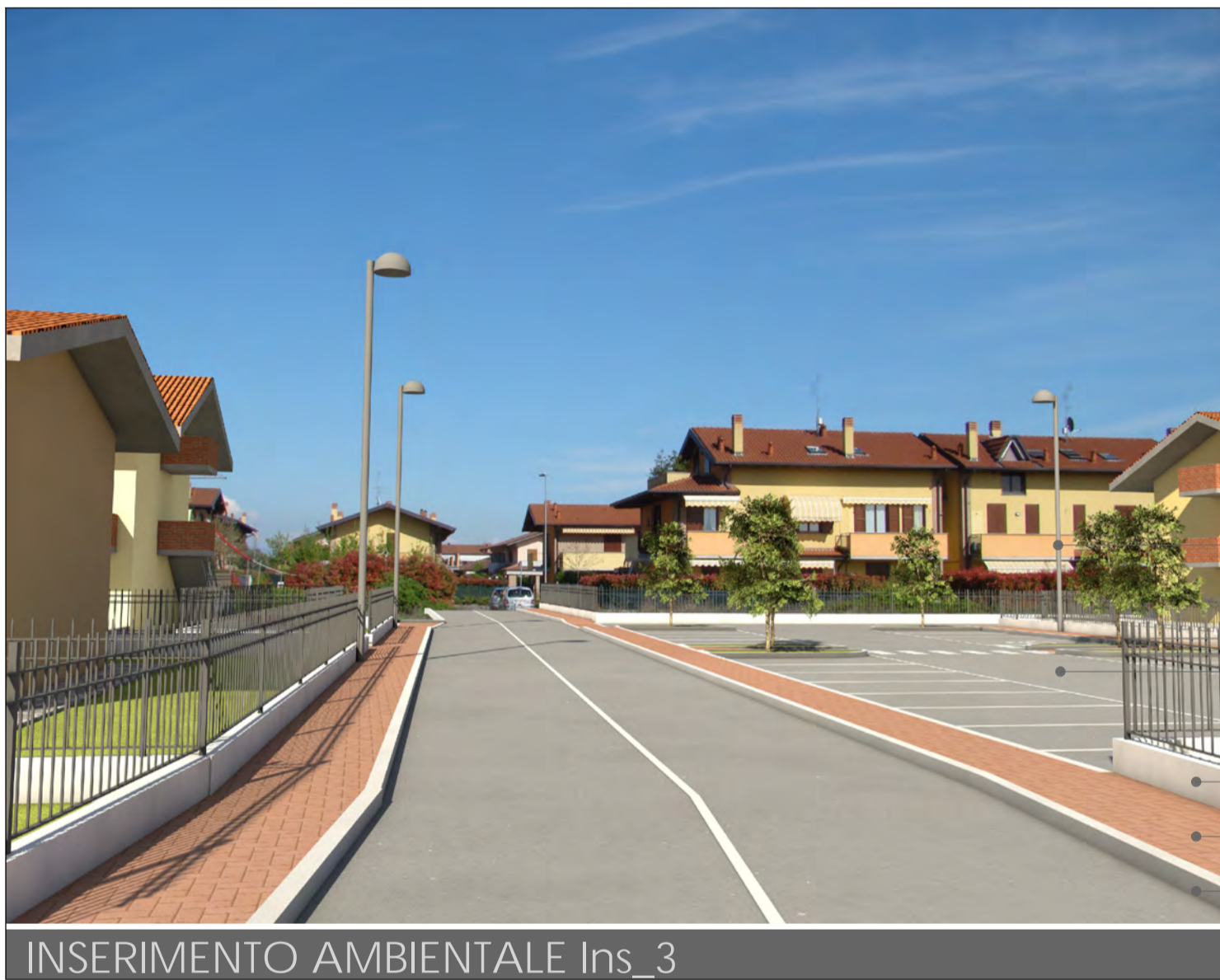
INSERIMENTO AMBIENTALE Ins_3