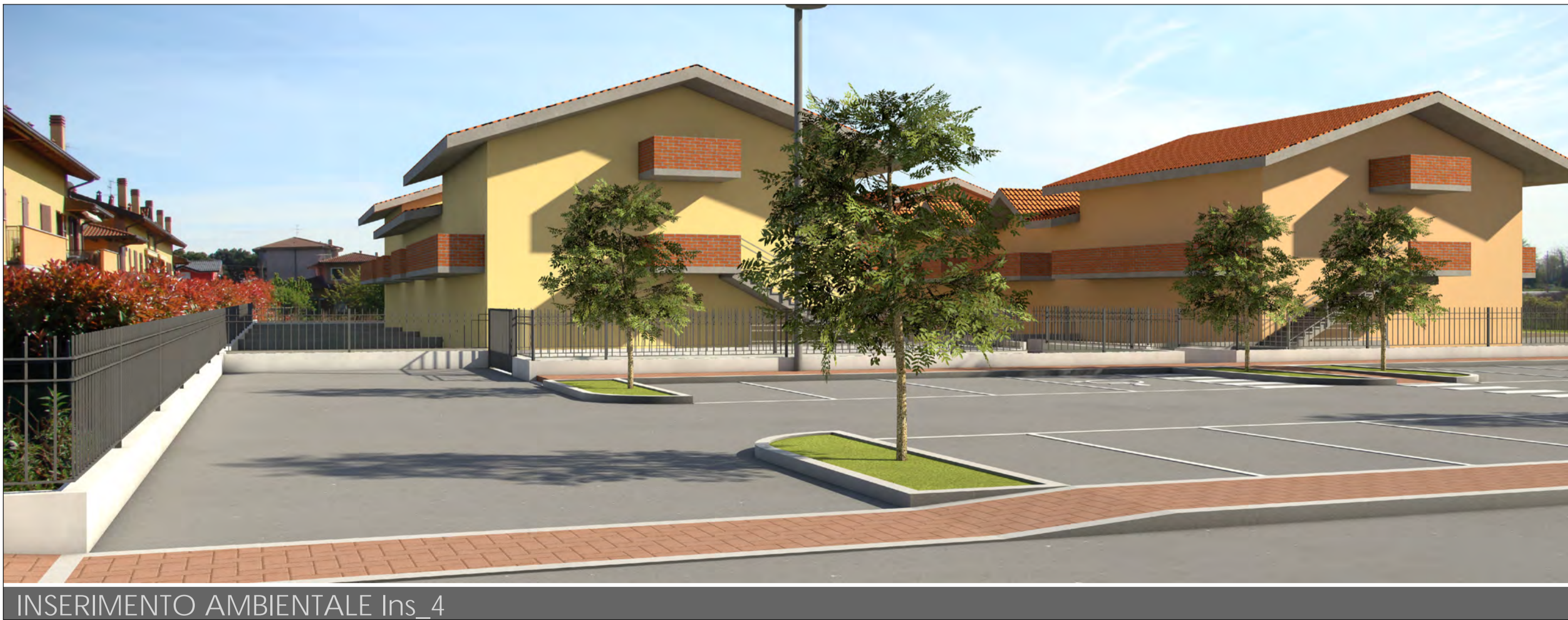
INSERIMENTO AMBIENTALE Ins_4