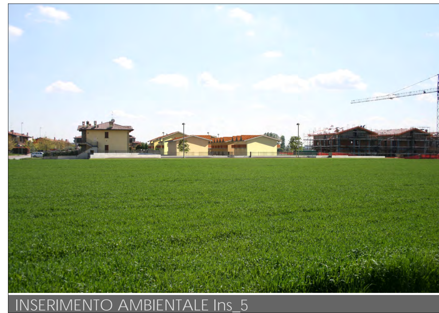
INSERIMENTO AMBIENTALE Ins_5