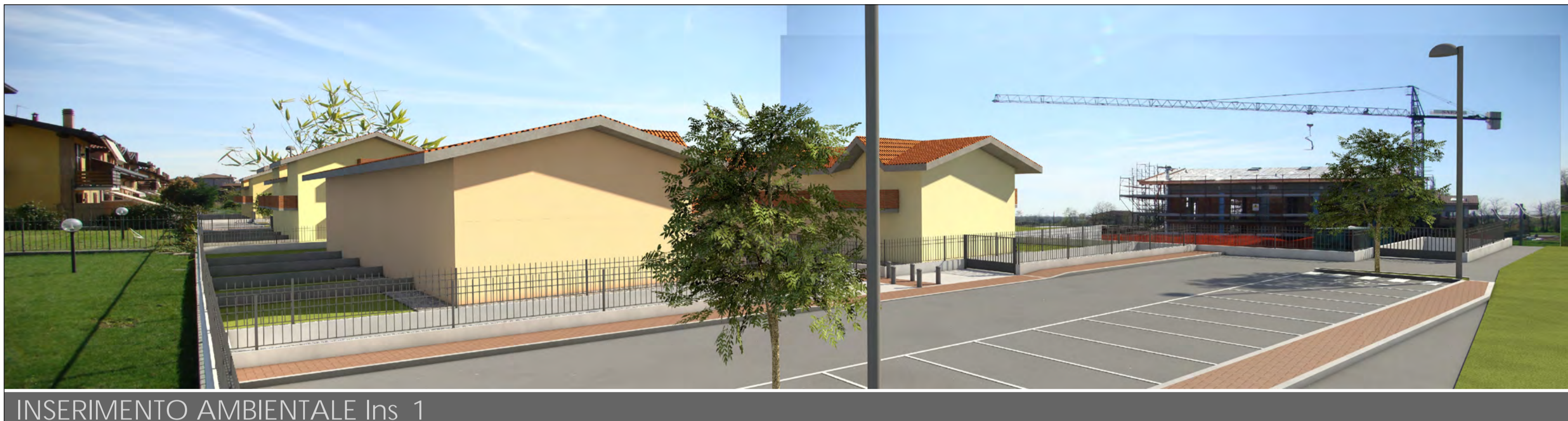
INSERIMENTO AMBIENTALE Ins_1