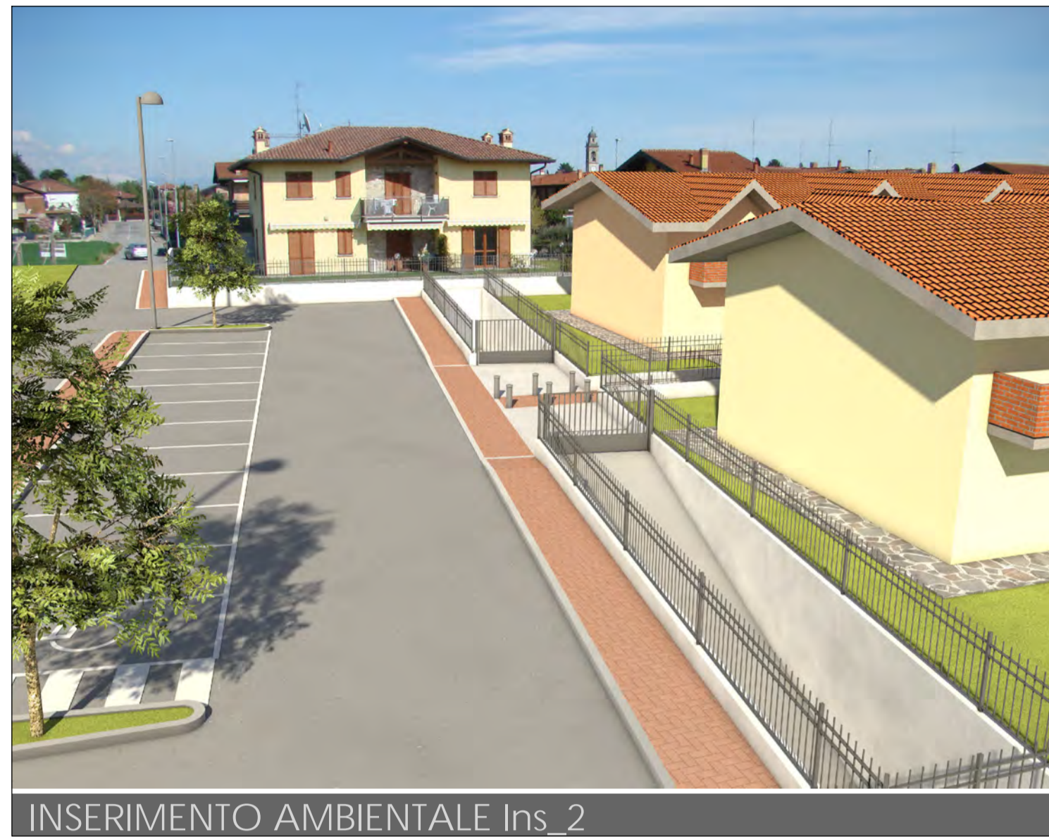
INSERIMENTO AMBIENTALE Ins_2