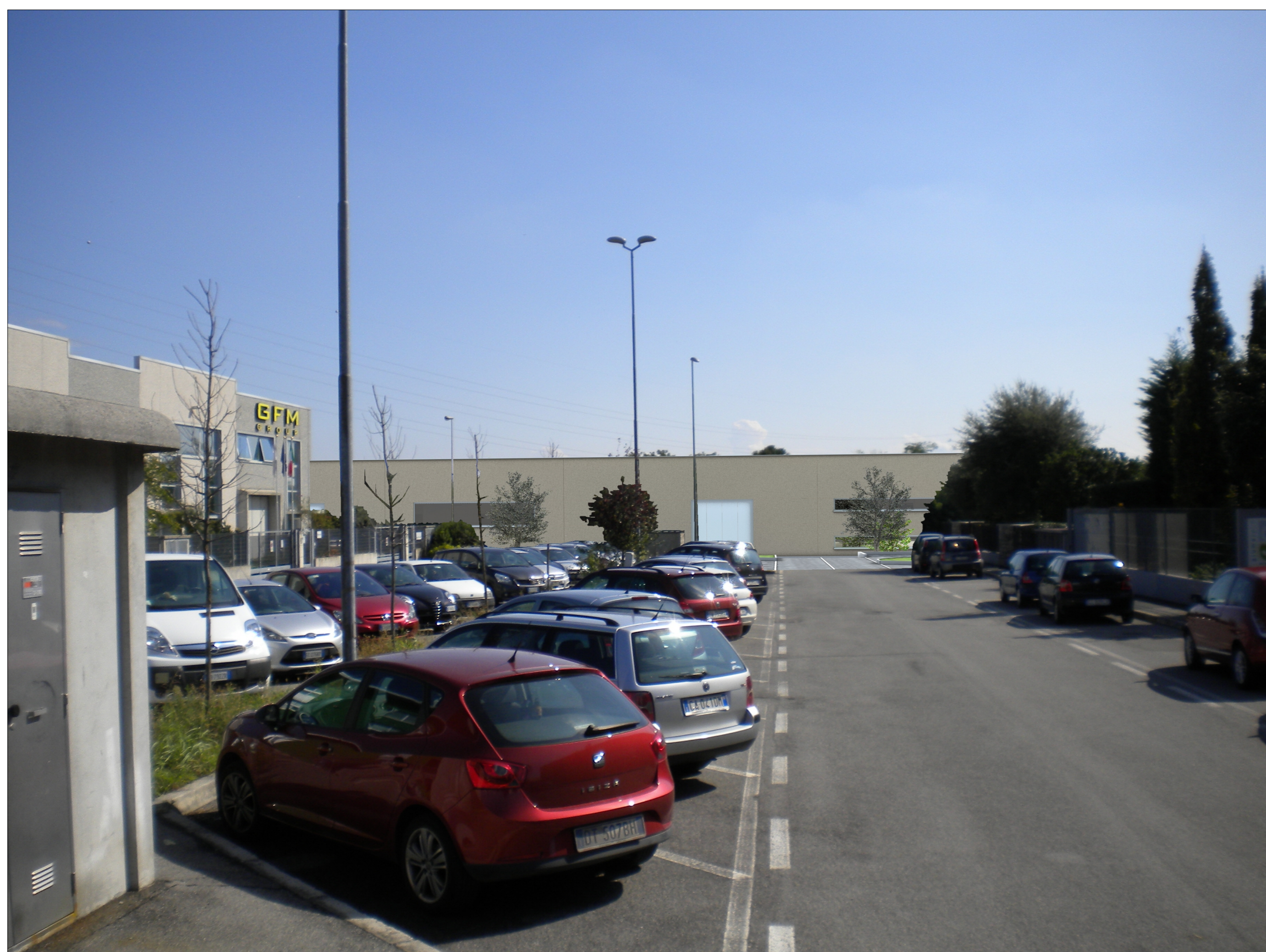
SIMULAZIONE FOTOGRAFICA 4 RENDERING