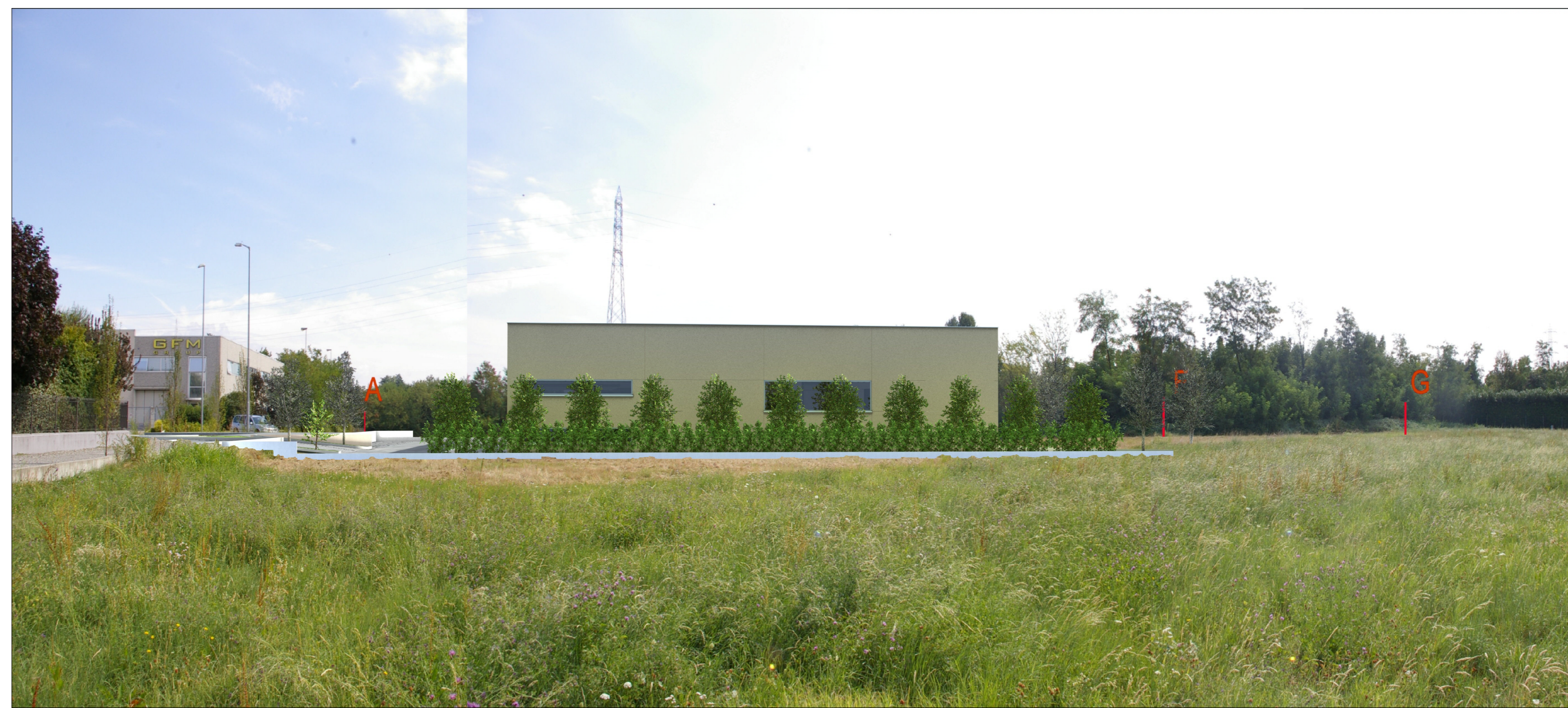
SIMULAZIONE FOTOGRAFICA 2 RENDERING