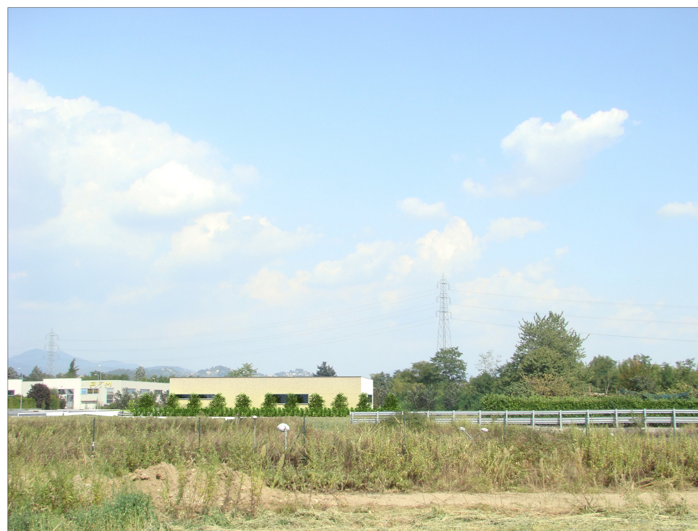
SIMULAZIONE FOTOGRAFICA 5 RENDERING

COMUNE DI BONATE SOPRA - Provincia di BERGAMO