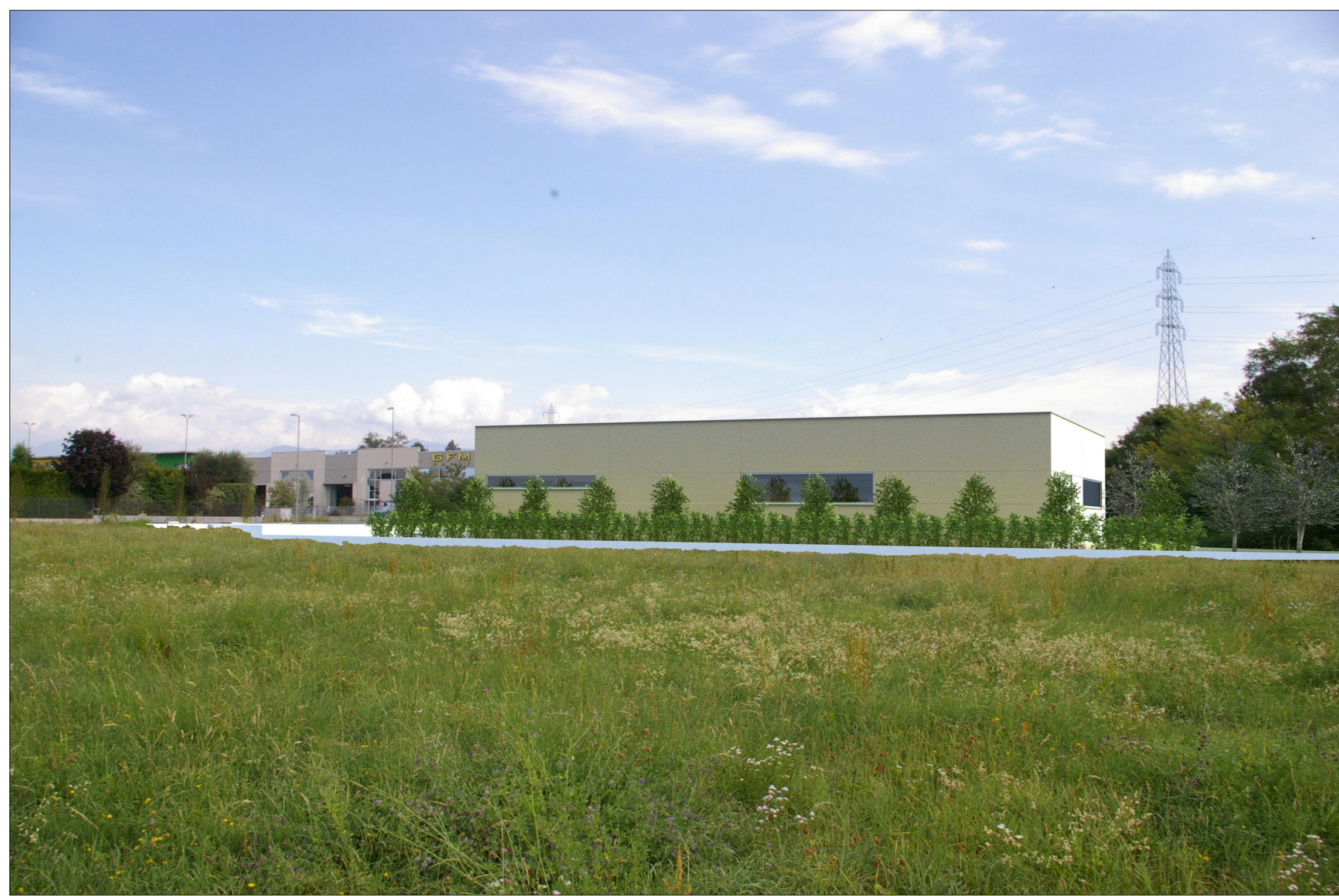
SIMULAZIONE FOTOGRAFICA 1 RENDERING