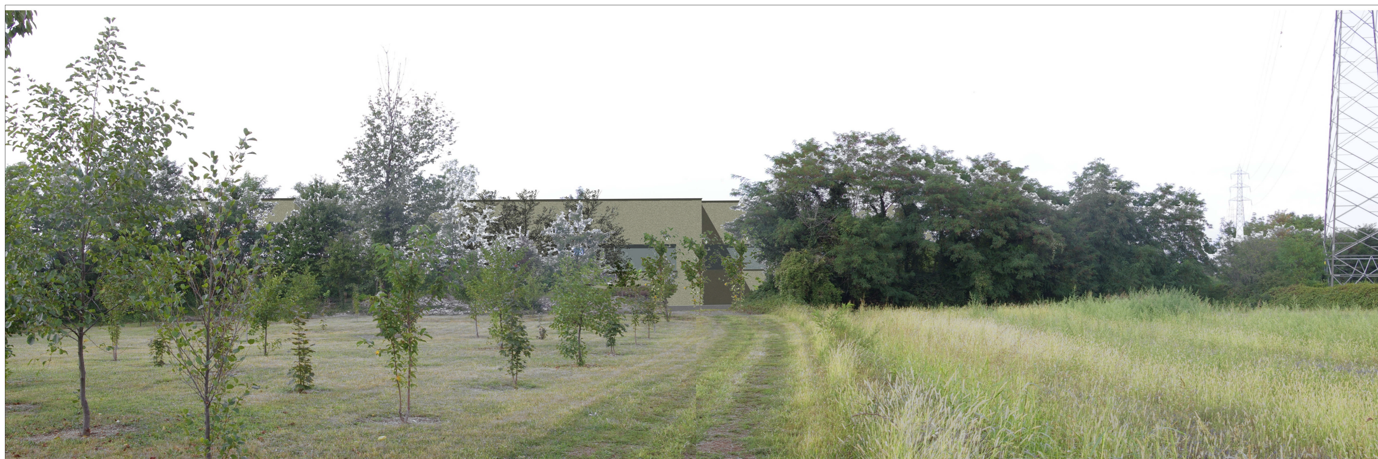
SIMULAZIONE FOTOGRAFICA 3 RENDERING