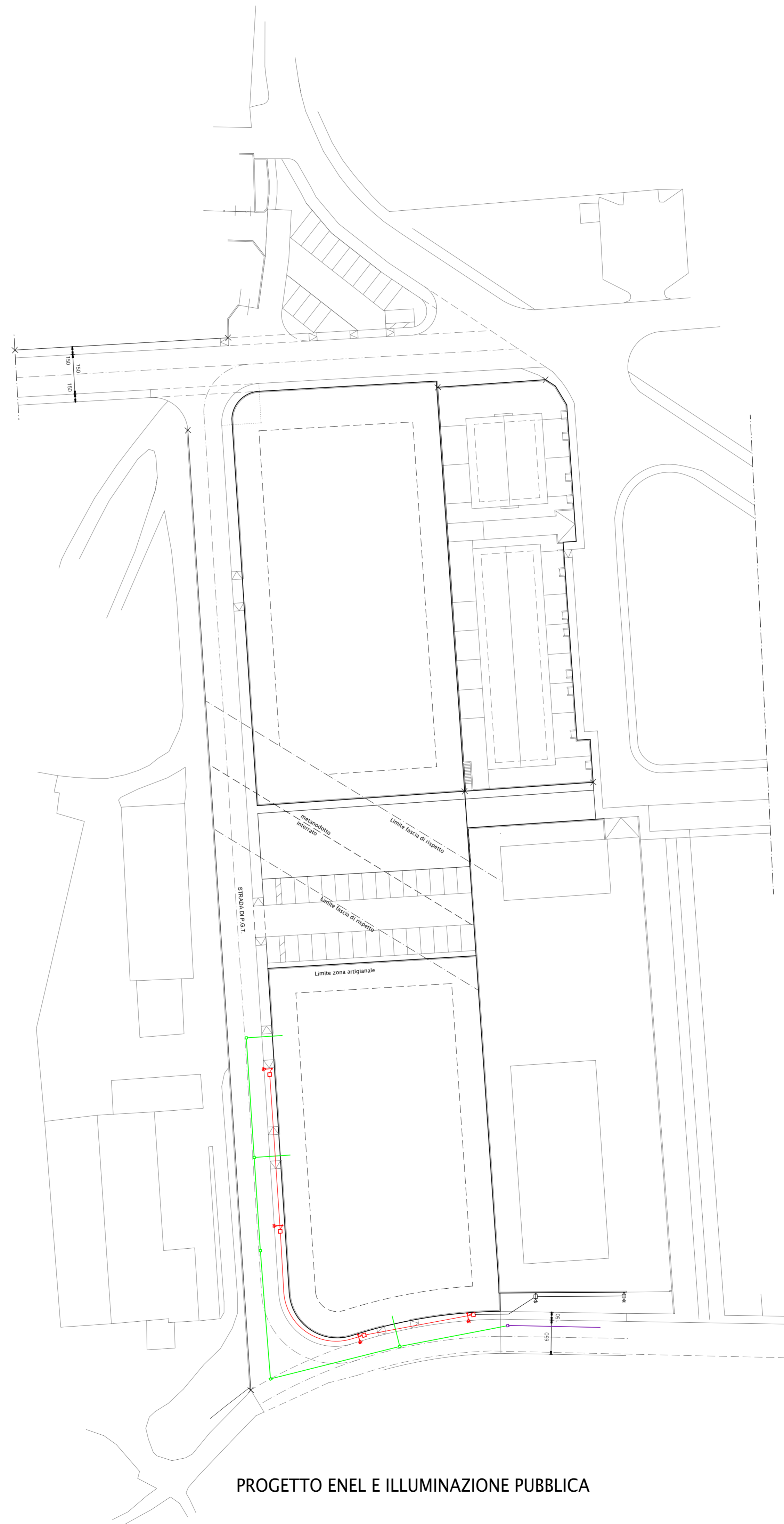
PROGETTO ENEL E ILLUMINAZIONE PUBBLICA