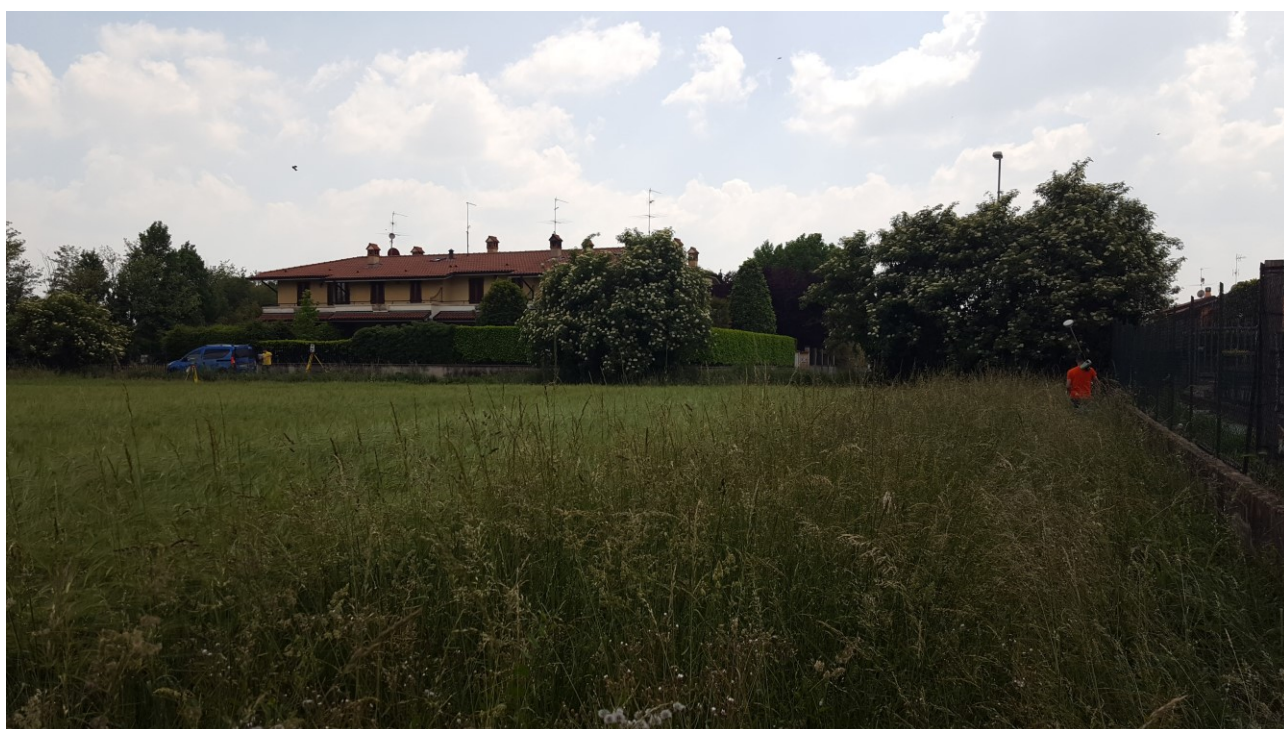
Vista 10 verso sud