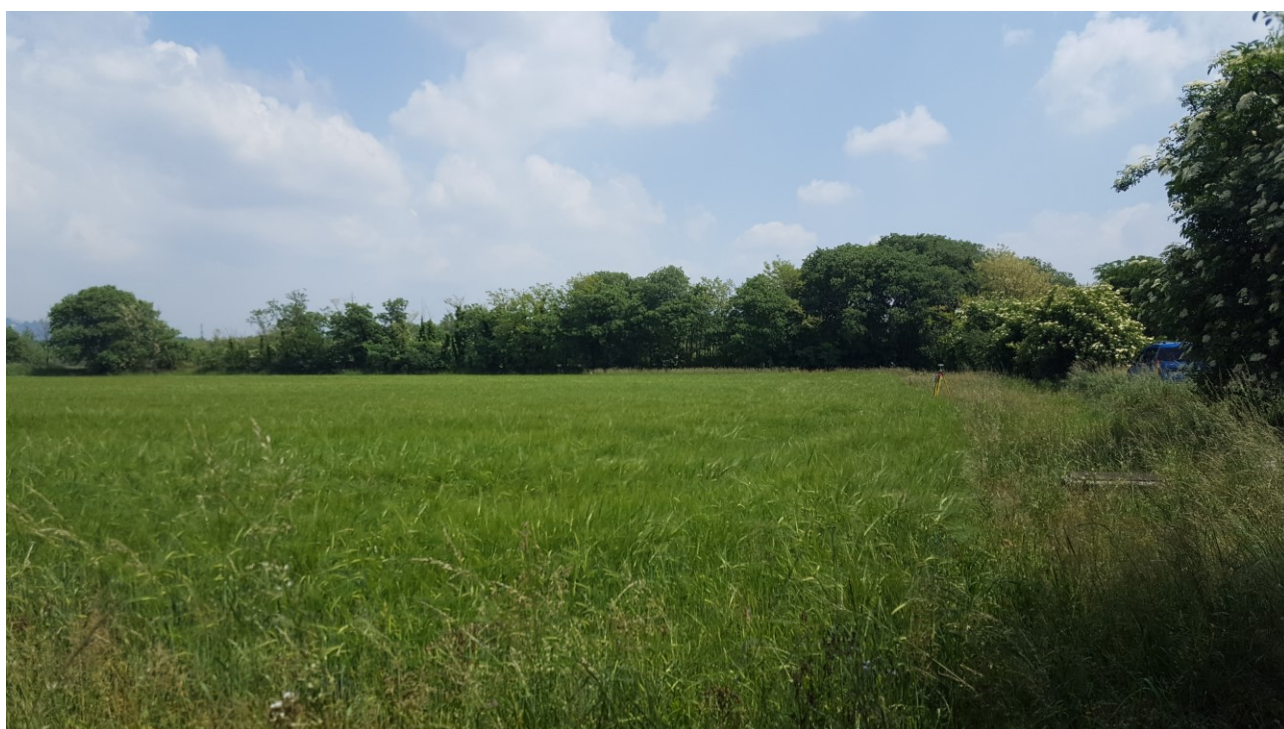
Vista 6 verso est