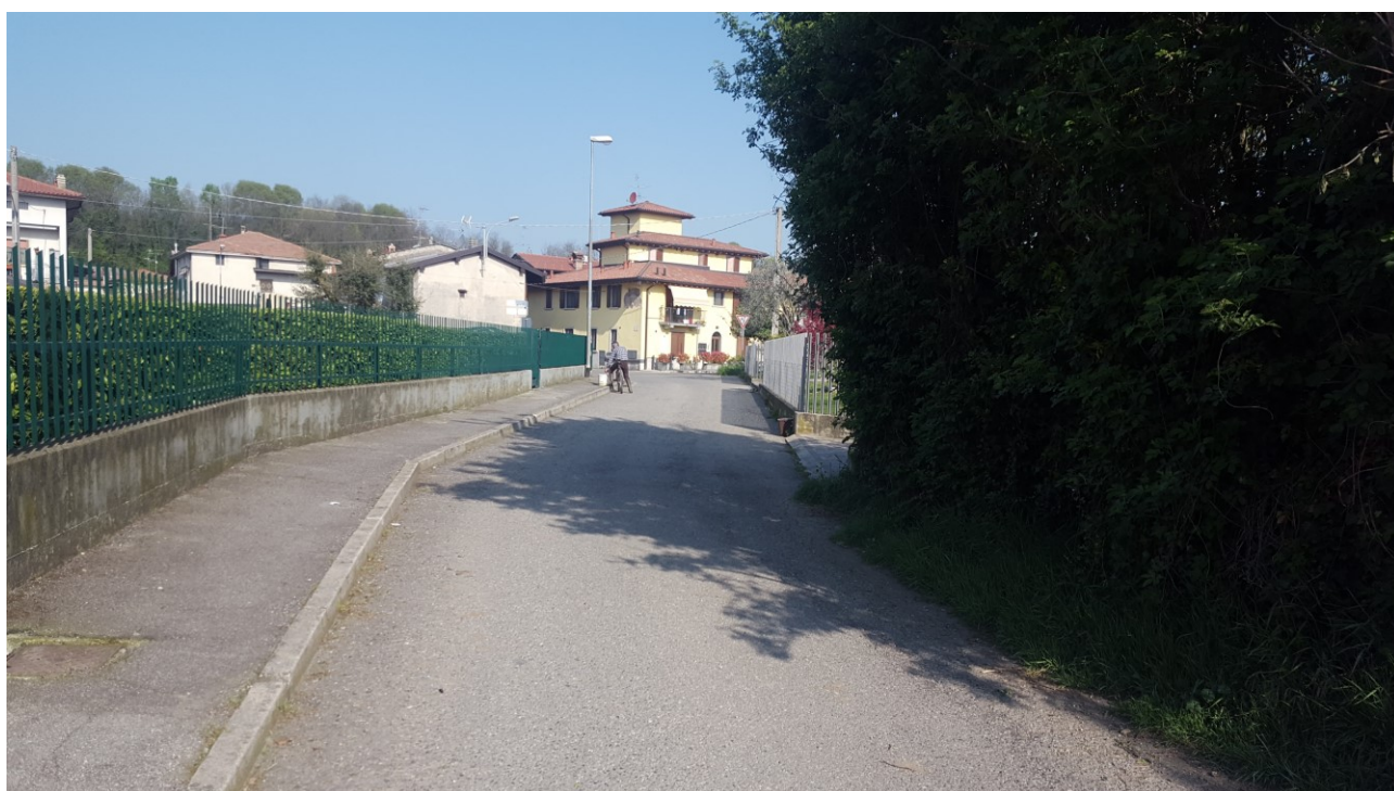
Vista 2 verso ovest