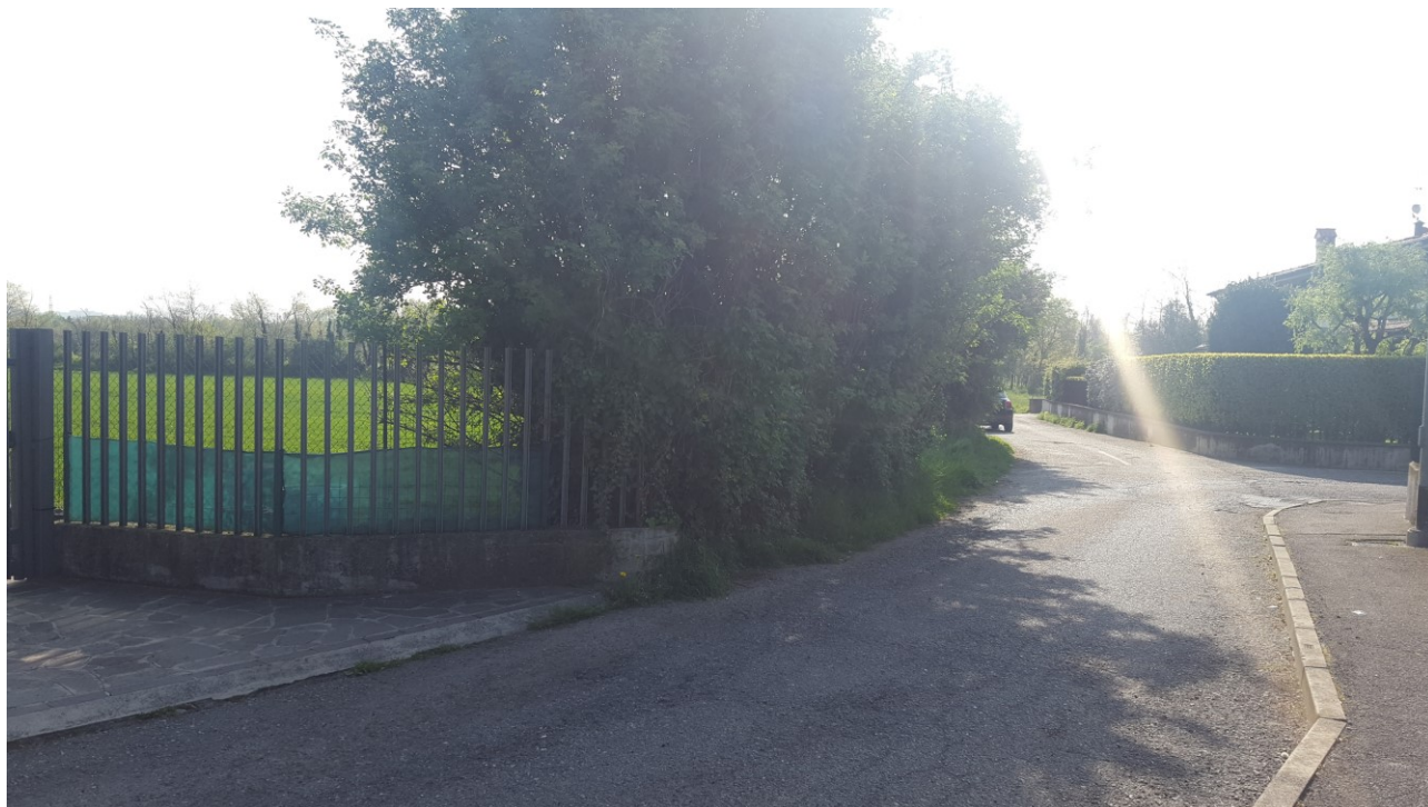
Vista 1 verso est