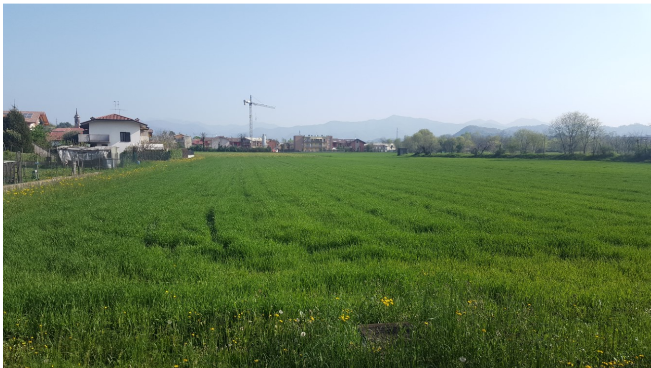
Vista 5 verso nord