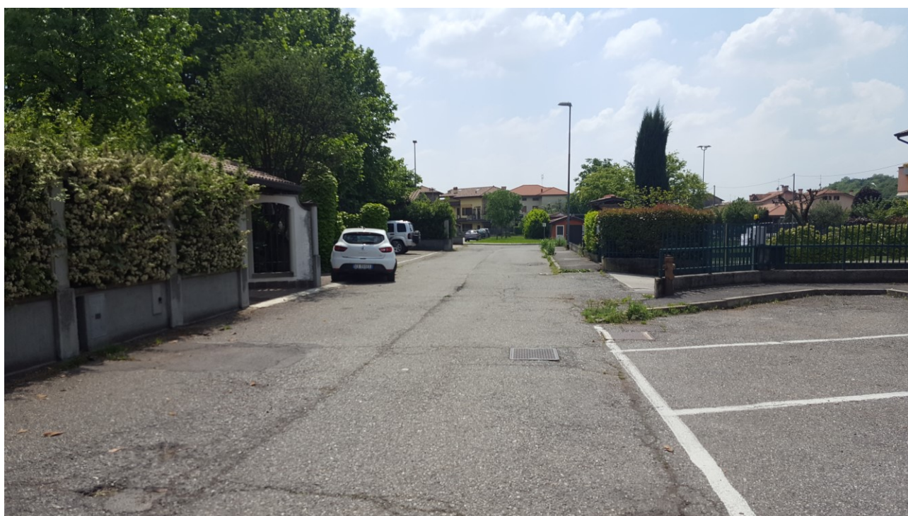
Vista 4 verso sud