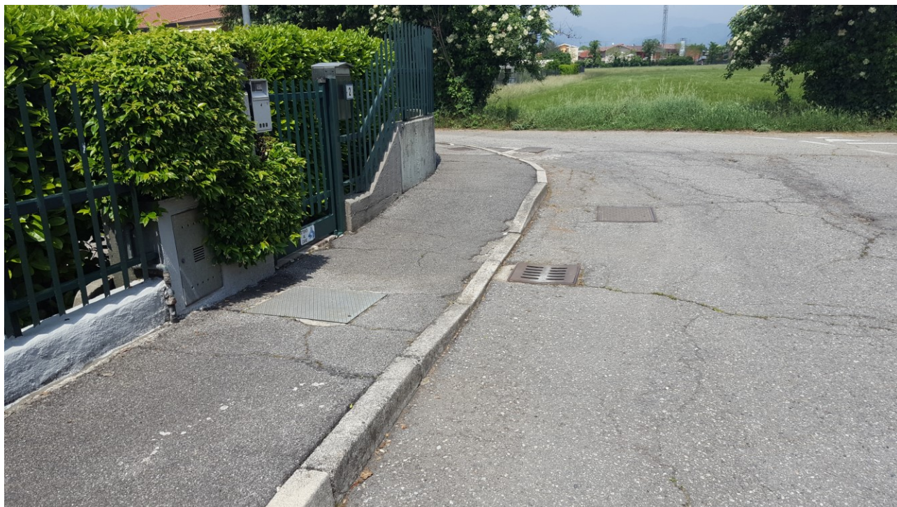
Vista 3 verso nord