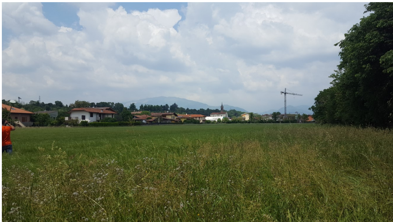
Vista 9 verso nord