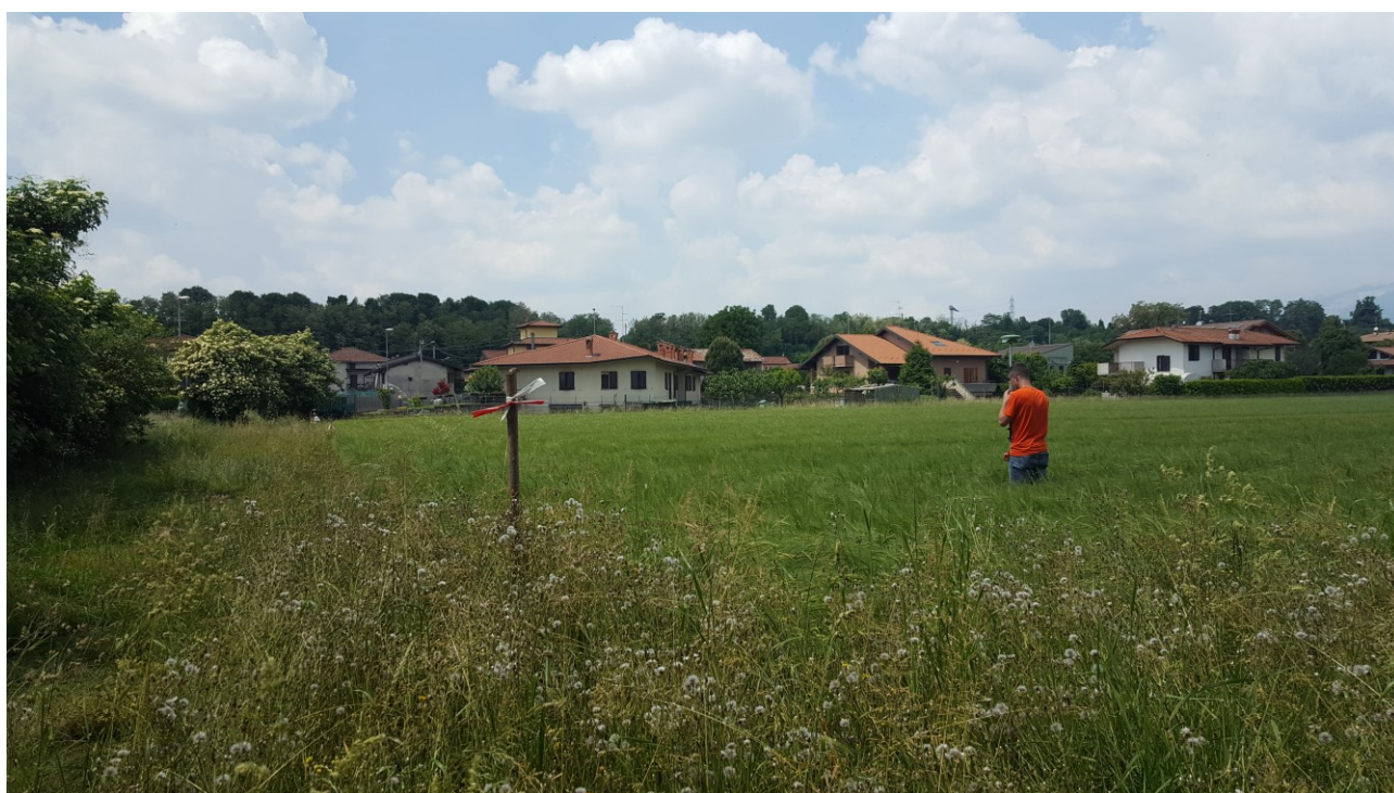
Vista 8 verso ovest