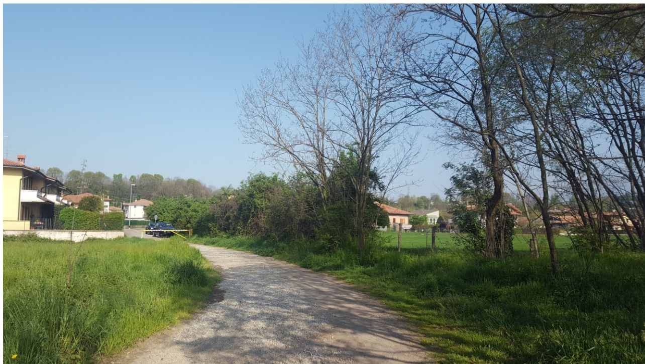
Vista 7 verso ovest