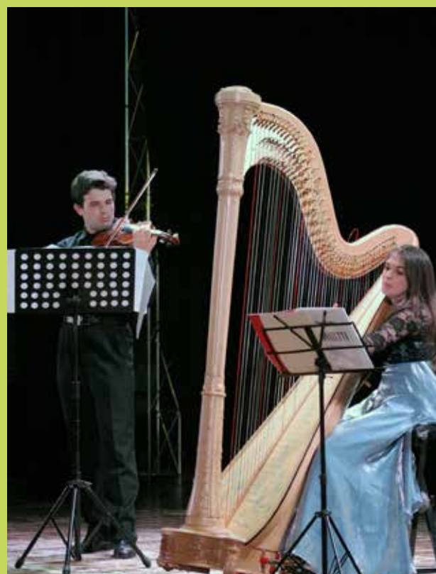
Rassegna Musica Classica presso il "Cine Teatro Verdi": Concerto violino - arpa del 29/11/2015.