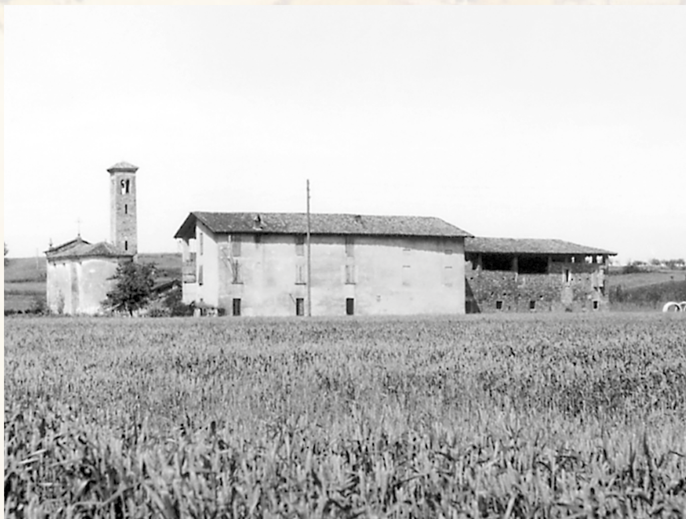
Rodi di sopra con la chiesa

Alcuni villaggi che furono invece dotati di un luogo di culto che, sopravvissuto, ne tramandò il toponimo fino a i nostri tempi. Questo si può consta-